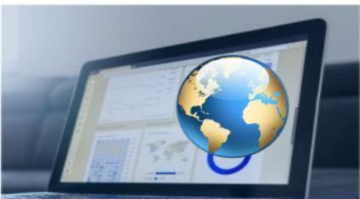
Dati Statistici Regionali