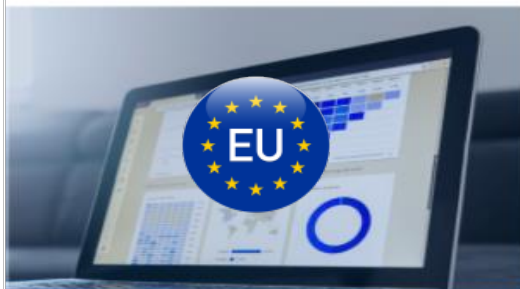
Dati Statistici Regionali