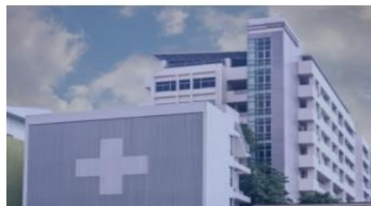
ASL e Distretti