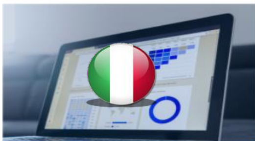
Dati Statistici Regionali